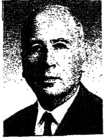
بقلم : الدكتور والتر ايتان

الاشكال ، بعد ان يتسلم رئيس جديد زمام الحكم ، وفق الخطوط التي تطلب بيلمر